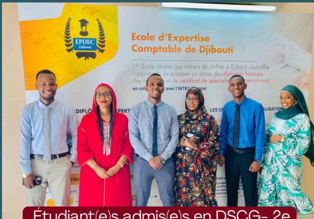
Étudiant(e)s admis(e)s en DSCG- 2e cycle d'Expertise Comptable

Ecole de Préparation aux Diplômes d'Expertise-Comptable