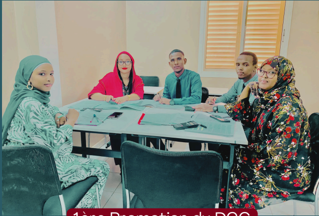
1ère Promotion du DCG